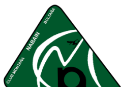
Club de Montaña Nabaín