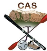
Club Atlético Sobrarbe 40 aniversario 1976-2016