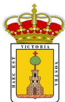
Ayuntamiento de Boltaña

CHAMONIX Adventure Festival – Grand Prize DOMZALE Mountain Film Festival – Best Mountaineering Film WILD & SCENIC Film Festival – Most Inspiring Adventure Film SHEFFIELD Adventure Film Festival – Best Film Bronze Award TRENTO Film Festival – Best Film on Climbing TRENTO Film Festival – Best Film on Exploration or Adventure BCN Sports Film – Grand Prize NEW ZEALAND Mountain Film Festival – Best Climbing Film NUOVI MONDI Film Festival – Audience Award HORSKY Film Festival – Best Documentary About Breaking The Rules and Limits In Climbing Culture HORSKY Film Festival – Public Choice